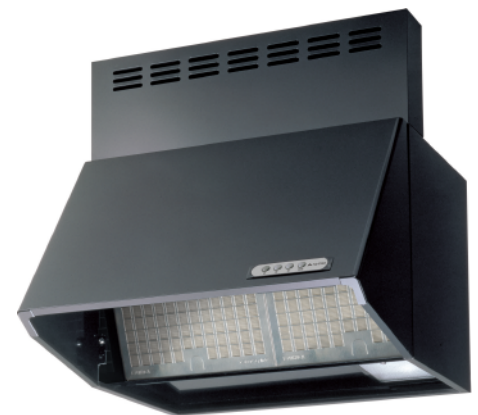
製品名：BDE-3HL-AP シリーズ 価格：¥65,800 (税抜価格)～ 規格：色 (ブラック/他) 幅 (60cm / 75cm / 90cm)